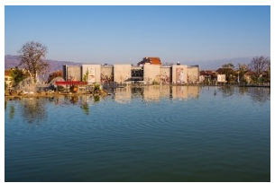
Petrich, das Geschichtliche Museum

Tag 2 - Freitag - Nach dem Frühstück, Besichtigung des Museums von Petrich -